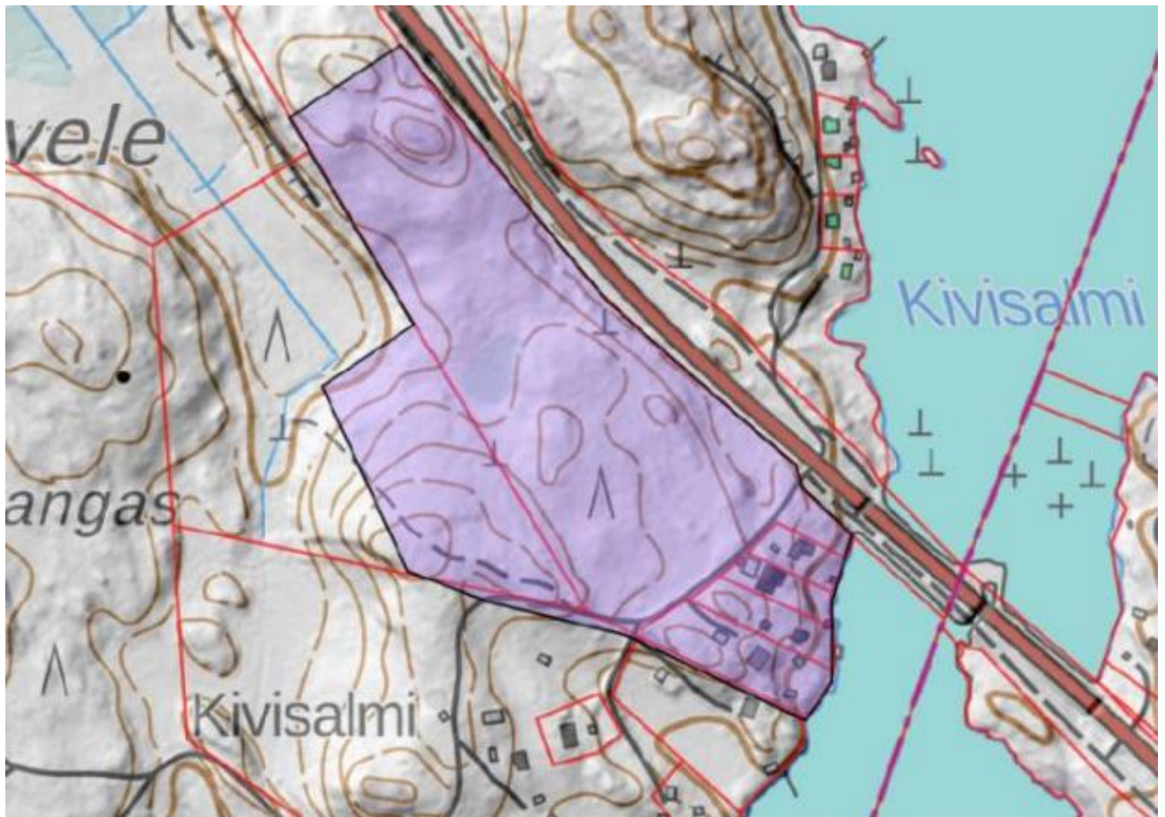
Suunnittelualue Kuivaketveleen saaren kaakkoisosassa, Kivisalmen rannalla.