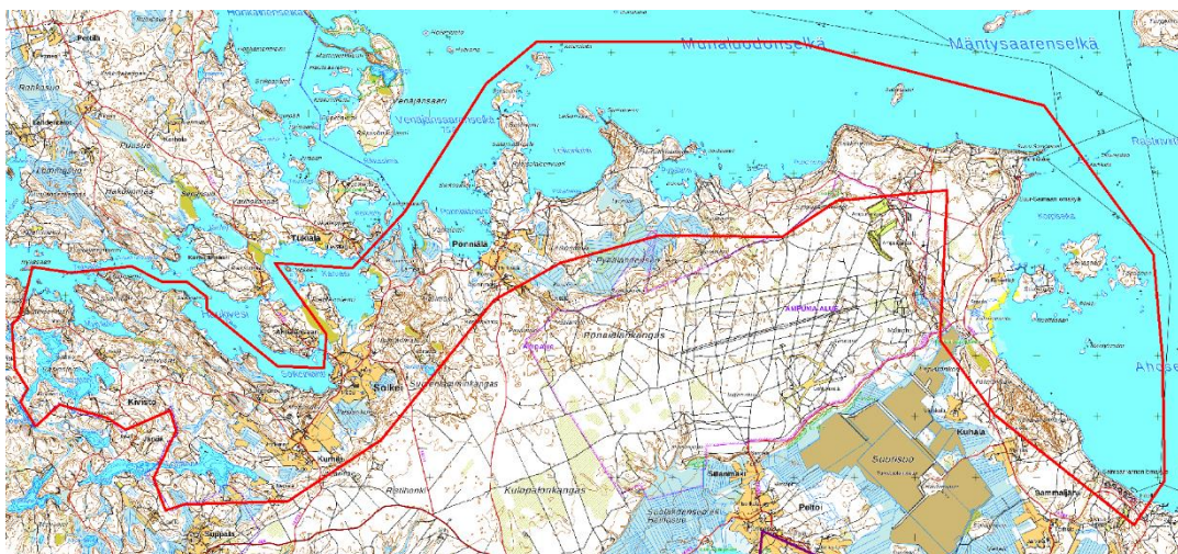
Solkein – Pönniälän alueen rantayleiskaavan alustava rajaus