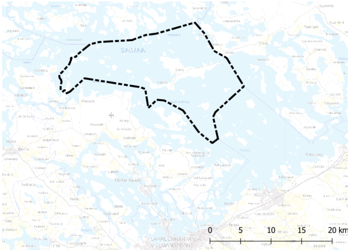
Kuva 1. Kaava-alue on esitetty kartassa mustalla katkoviivalla.

Yleiskaava-alue sijaitsee Taipalsaarella Suur-Saimaan puolella kattaen mm. Kyläniemen ja Venäjänsaarten alueen. Suurin osa alueesta on Saimaan vesistöä.