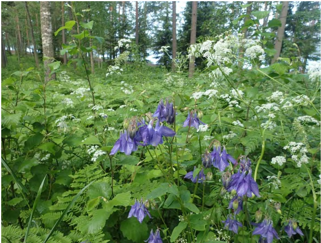
Kuva 10. Vuohenputki- ja lehtoakileijakasvustoa Konstunhiekkan uimarannan läheisyydessä.

Rannan läheisyydessä valoisiksi harvennetut kangasmetsät ovat paikoin hyvin kulttuurivaikutteisia ja reheviä. Kenttäkerroksessa esiintyy runsaasti mm. vuohenputkea ja nokkosta sekä myös todennäköisesti puutarhasta karannutta lehtoakileijaa.