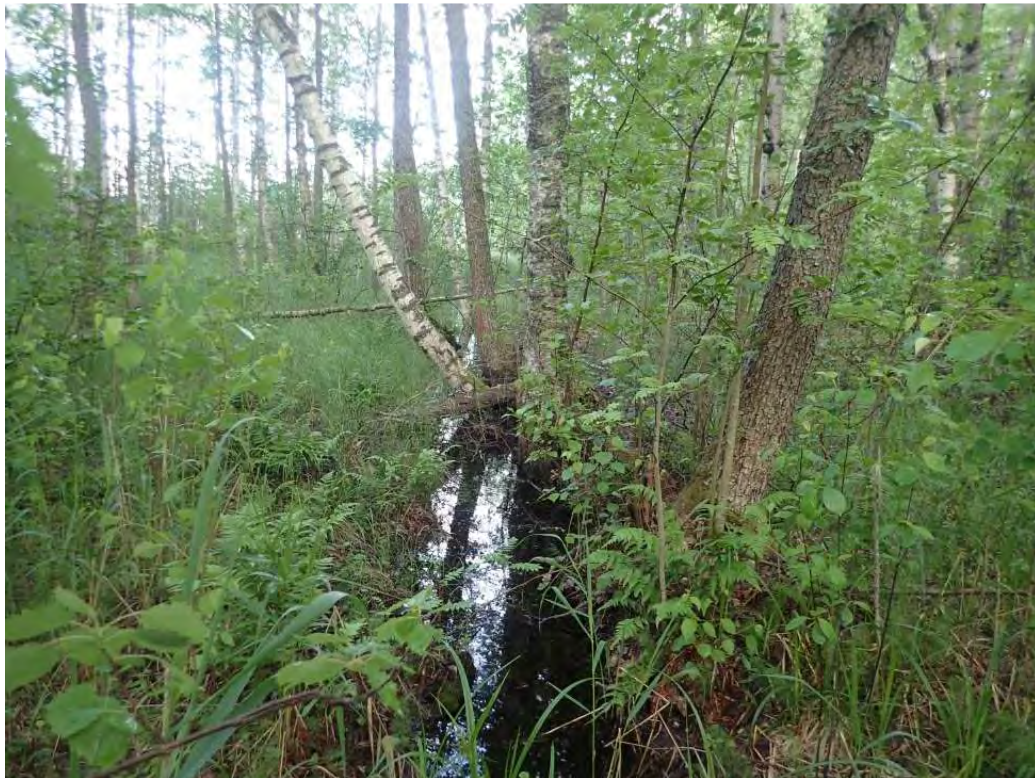
Kuva 6. Kostea korpikasvillisuutta Konstunniemen itäpuoleisella alueella.