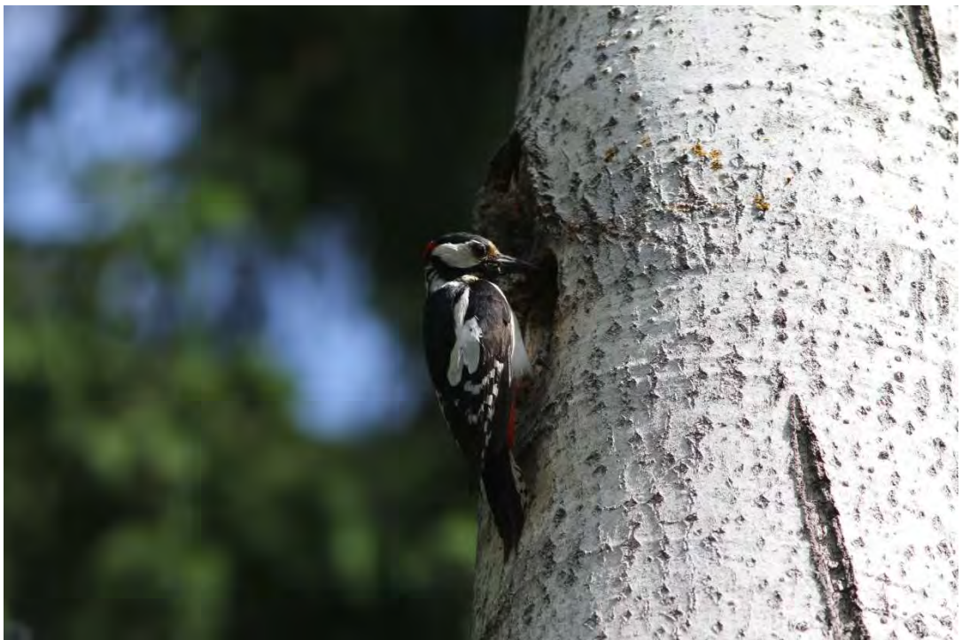
Kuva 11. Käpytikalla oli kesällä 2015 pesä Konstunrannan alueella.

Linnustollisesti selvitysalueen arvokkain osa on eteläosan metsittynyt peltoalue rantoineen. Tällä aluskasvillisuudeltaan rehevällä ja lehtipuuvaltaisella alueella esiintyy merkittävä osa alueella pesivistä lintulajeista (kuva 12).