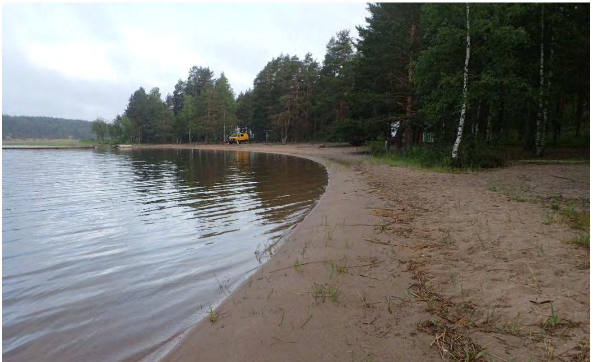
Kuva 3. Konstunhiekan uimarantaa.

Metsäalueet ovat pääasiassa tuoretta ja kuivahkoa kangasmetsää. Selvitysalueen eteläosa on metsittynyttä peltoa (kuva 4). Tällä alueella maaperä on rehevää ja kasvillisuus on muuta selvitysalueita monipuolisempaa. Alueella esiintyy lehtipuuvaltaista luhtametsää ja paikoin myös tuoreen ja kuivan lehdon kasvillisuutta.