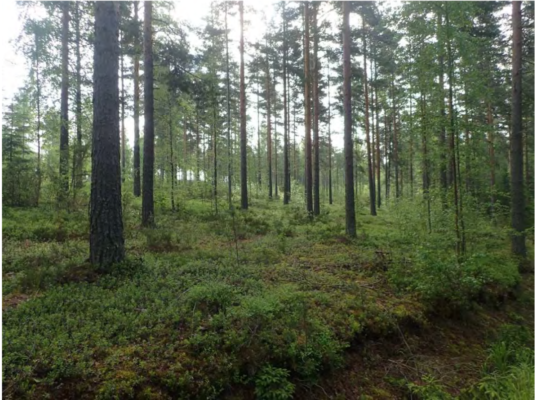
Kuva 9. Kuivahkoa puolukkatyyppin kangasmetsää sairaalan eteläpuolisella rinteellä