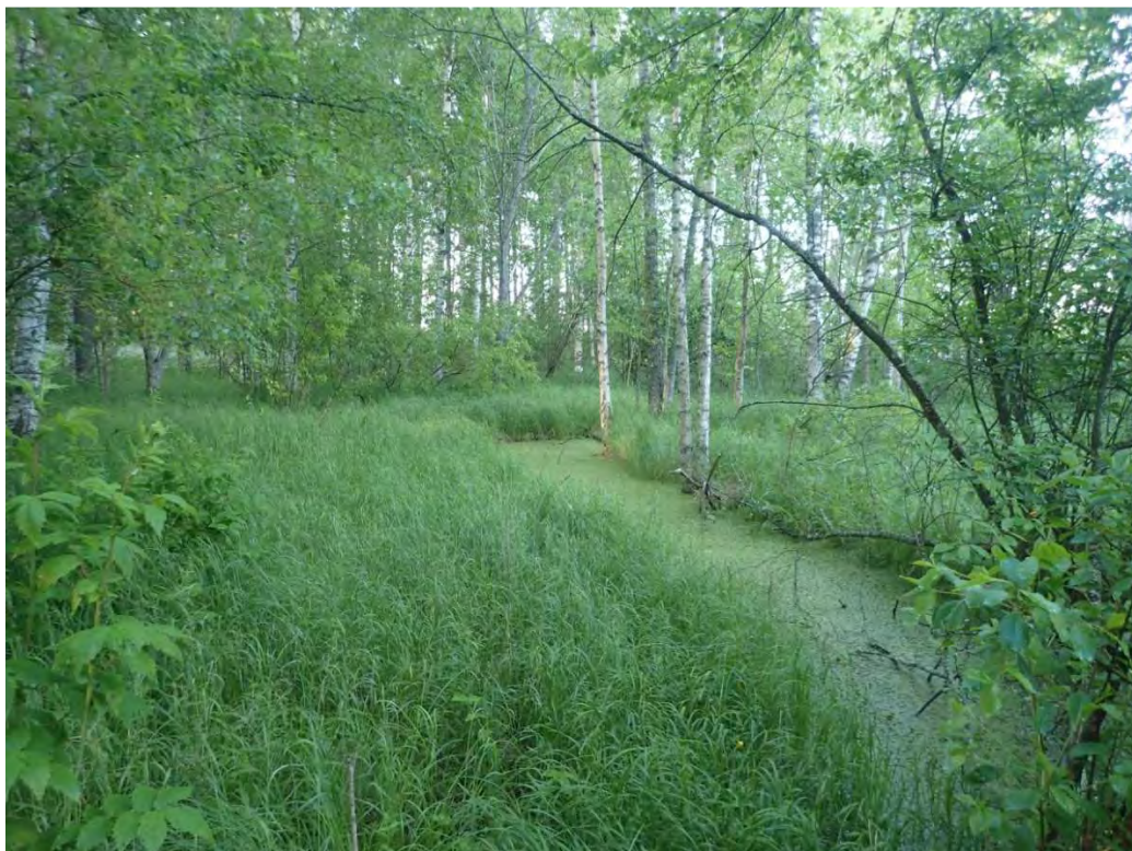
Kuva 7. Entiselle pellolle kehittyntä luhtakasvillisuutta