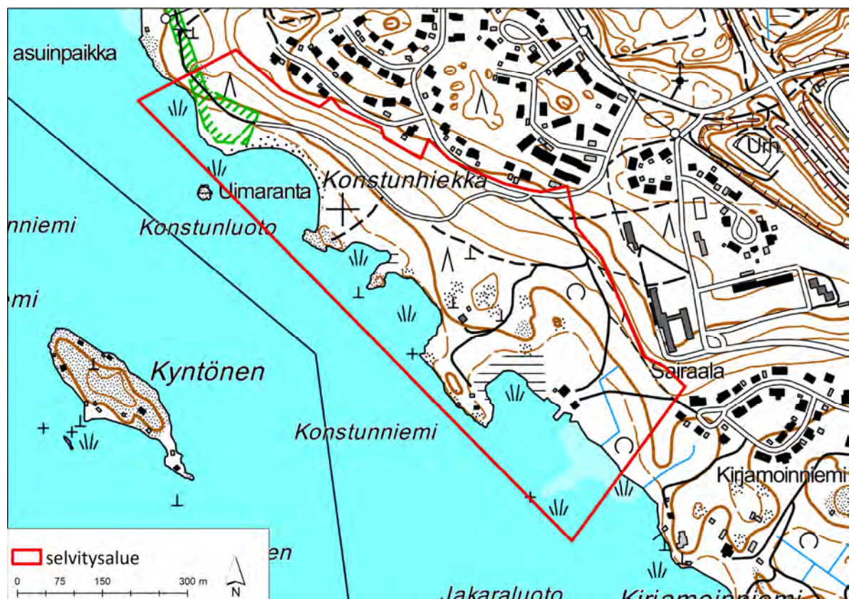
Kuva 1. Konstunrannan selvitysalue.

Suunnittelualue kattaa 103 hehtaarin laajuisen alueen, joka käsittää Konstunrannan alueen Taipalsaaren Saimaanharjun länsiosassa. Selvitysalueen sijainti on esitetty kuvassa 1.