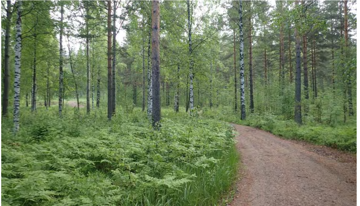
Kuva 2. Selvitysalueelle tyypillistä harvennettua kangasmetsää.

Metsäalueet ovat pääasiassa tuoretta ja kuivahkoa kangasmetsää. Selvitysalueen eteläosa on metsittynyttä peltoa (kuva 4). Tällä alueella maaperä on rehevää ja kasvillisuus on muuta selvitysalueita monipuolisempaa. Alueella esiintyy lehtipuuvaltaista luhtametsää ja paikoin myös tuoreen ja kuivan lehdon kasvillisuutta.