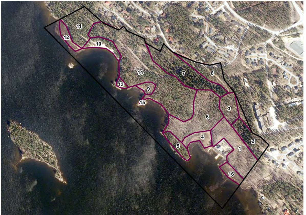
Kuva 5. Selvitysalueen pääkasvillisuustyypit kuvioittain.