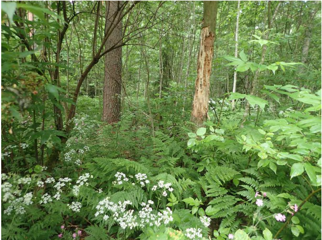
Kuva 8. Hyvin rehevää, lehtomaista kangasmetsää ja tuoretta lehtoa selvitysalueen keskiosissa.