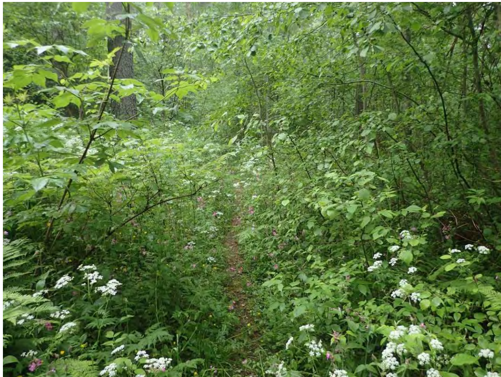
Kuva 13. Pieni lehtoalue selvitysalueen keskiosissa.

lehtolaikut, joiden ominaispiirteitä ovat lehtomulta, vaateliias kasvillisuus sekä luonnontilainen tai luonnontilaisen kaltainen puusto ja pensaskasvillisuus).