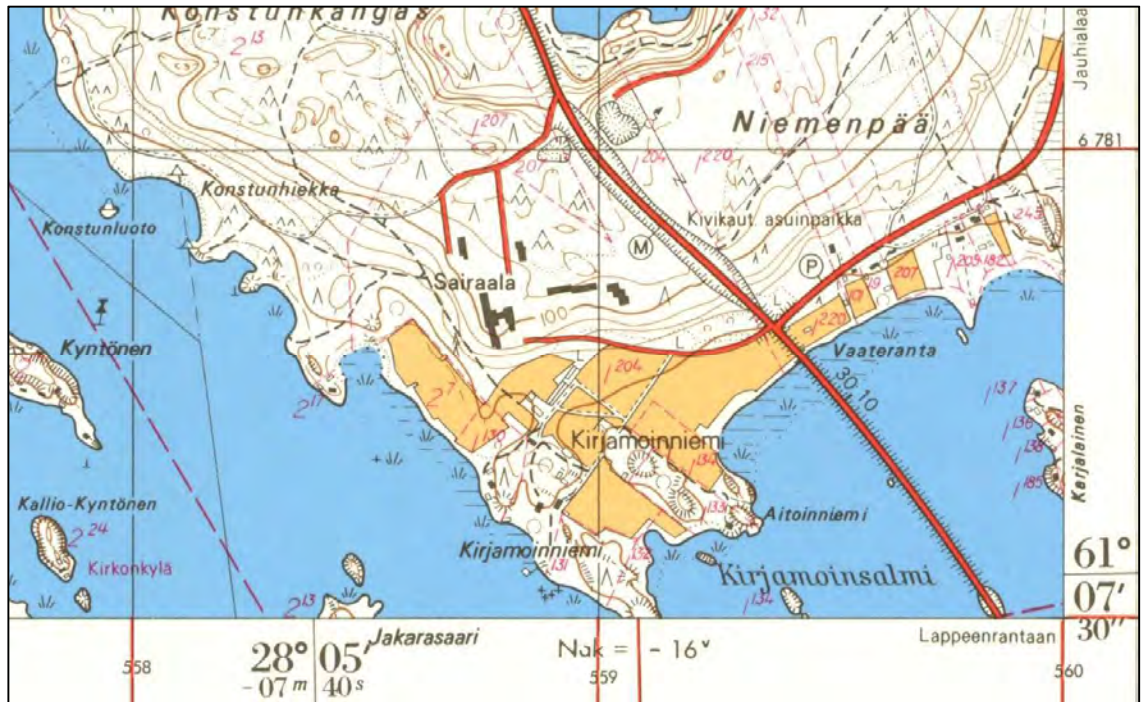
Kuva 4. Ote vuoden 1971 peruskartasta (1:20 000)(Maanmittauslaitos 2015), jossa selvitysalueella sijaitsee vielä avoin peltoalue.