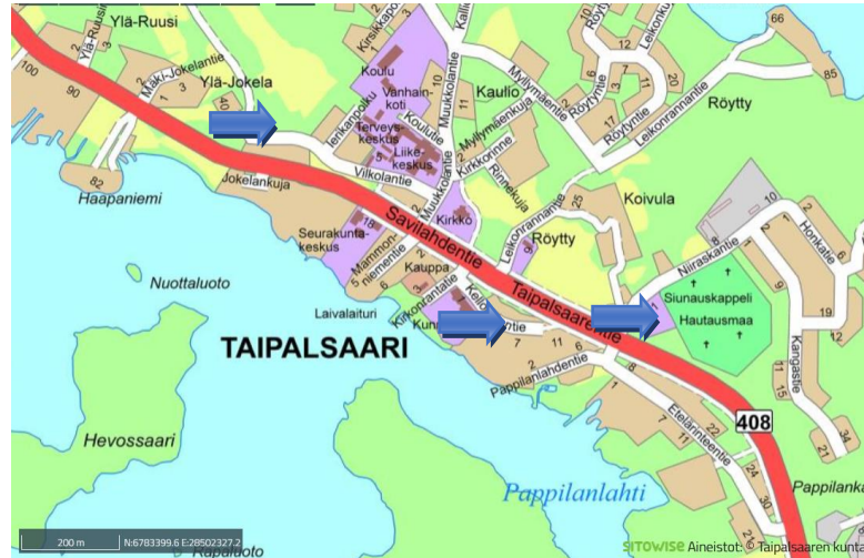
Suunnittelualueen seudulliset sijainnit

Asemakaavan laajennusalue on rakentamaton ja se on käytännössä avohakkuualuetta. Muutosalueet ovat jo rakentuneita lukuun ottamatta pientä puistoaluetta Kellomäentien ja Taipalsaarentien välissä.