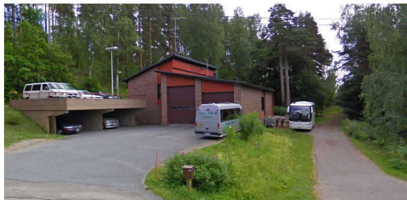
Asuinliikerakennus Niiraskantien varrella