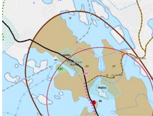
Ote Etelä-Karjalan maakuntakaavasta suunnittelualueelta

Etelä-Karjalan maakuntakaavan 2040 osallistumis- ja arviointisuunnitelma oli nähtävillä kesällä 2021.