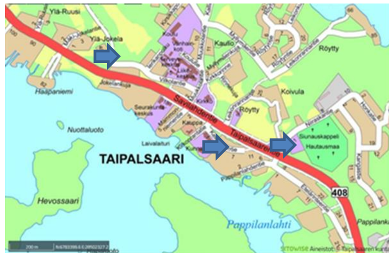
Suunnittelualueiden seudulliset sijainnit

Asemakaavan muutosalueet ja laajennusalueet sijaitsevat Taipalsaaren kunnassa Kirkonkylän asuinalueella.