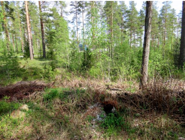
Kuva 23. Puutarhajatettä suppien välistä. Taustalla supan kangasvuokolle sopivaa kasvu ympäristöä.