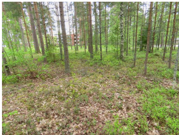
Kuva 28. Koilliskulman MT-männikköön on paikoin ajettu maata (etuala) Kuvaussuunta koilliseen.