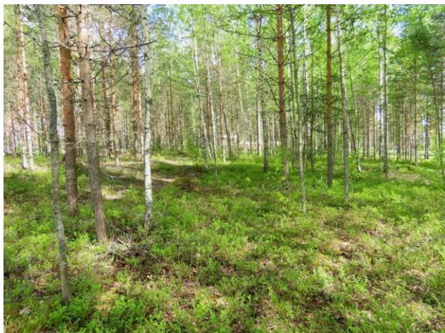
Kuva 27. Osa-alueen koilliskulman MT-kankaan nuorta männikköä. Kuvaussuunta lounaaseen.