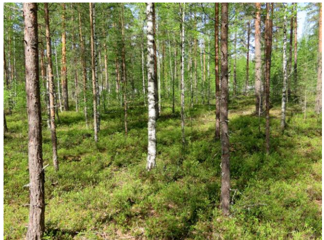
Kuva 14. Osa-alueen itäosien nuorempaa mäntymetsää (MT). Kuvaussuunta länteen.

Suositus. Alueella ei todettu rauhoitettuja tai uhanalaisia kasvilajeja, uhanalaisia lintulajeja tai uhanalaisille lajeille (direktiivin IV(a) lajit) soveltuvia elinympäristöjä, jotka olisi erityisesti huomioitava maankäytön suunnittelussa. Alueella ei todettu kangasvuokkoa.