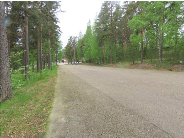
Kuva 29. Osa-aluetta halkoo katu. Rivitalo kuvassa takana oikealla ylärinteessä. Kuvaussuunta länteen.

Metsäkaistaleella oli todettavissa myös pihapiiristä levinnyttä lajistoa (Kuva 30.). Alarinne kadun kaakkoispuolella on voimakkaasti muokattua aluetta (kunnallistekniikkaa ja sen vaatimaa tiestöä) (Kuva 31.). Rinteeseen on myös kasattu runsaasti puutarhajätettä. Vain alarinteen itäosassa oli todettavissa selvemmin alkuperäisbiotooppia (MT-kangas), joka kasvoi nuorta mäntyä (Kuva 32.). Rinteen alin osa Kirjamoinkaaren varressa on kadunvarsipuistoa. Rinteen alkuperäislajisto indikoi tuoretta ja aivan alarinteessä lehtomaista kangasta (MT, OMT)