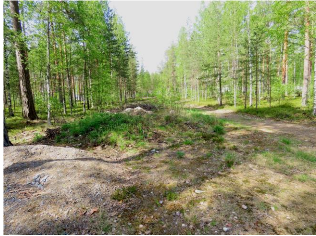
Kuva 16. Osa-alueen itäosaan on rakennettu tieuraa ja läjitetty maata.

Suositus. Alueella ei todettu rauhoitettuja tai uhanalaisia kasvilajeja, uhanalaisia lintulajeja tai uhanalaisille lajeille (direktiivin IV(a) lajit) soveltuvia elinympäristöjä, jotka olisi erityisesti huomioitava maankäytön suunnittelussa. Alueella ei todettu kangasvuokkoa.