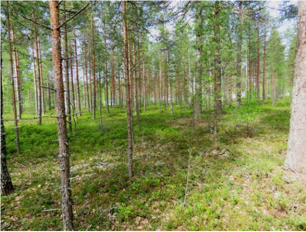
Kuva 15. Ankkurikaaren länsiosan osa-alue on pääosin nuorta MT-männikköä.