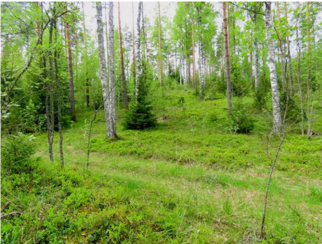
Kuva 19. Supan loivaa, kumpuilevaa pohjoisrintettä