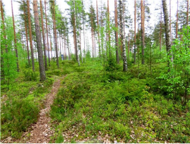
Kuva 17. Osa-alueen reunamuodostuman lakialuetta. Kuva lämpökeskukselta pohjoiseen.