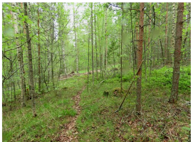
Kuva 32. Kadun alarinteen nuorta MT-männikköä aivan osa-alueen itäosassa. Kuvaussuunta länteen.