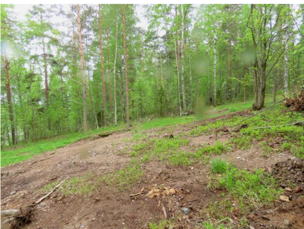
Kuva 31. Kadun alarinteen voimakkaasti muokattua rinnemetsää. Kuvaussuunta länteen