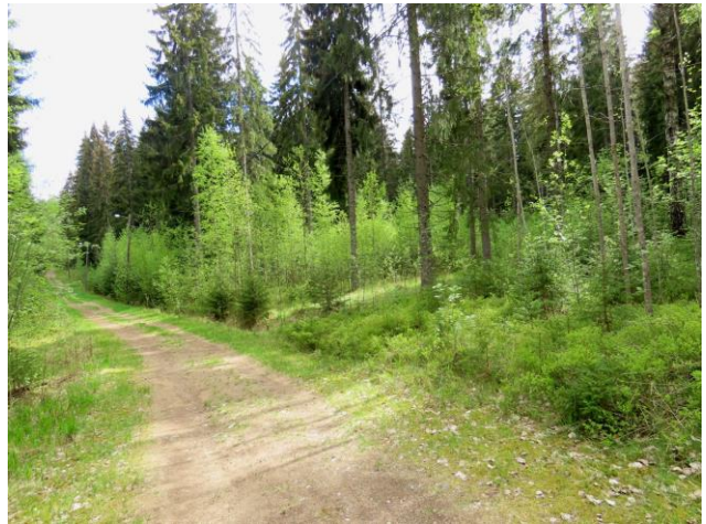
Kuva 20. Tiepohjaa (kuntopolku) laajana avautuvan supan pohjalta, kuvaussuunta kaakkoon.

Suositus. Alueella ei todettu rauhoitettuja tai uhanalaisia kasvilajeja, uhanalaisia lintulajeja tai uhanalaisille lajeille (direktiivin IV(a) lajit) soveltuvia elinympäristöjä, jotka olisi erityisesti huomioitava maankäytön suunnittelussa. Alueella ei todettu kangasvuokkoa.