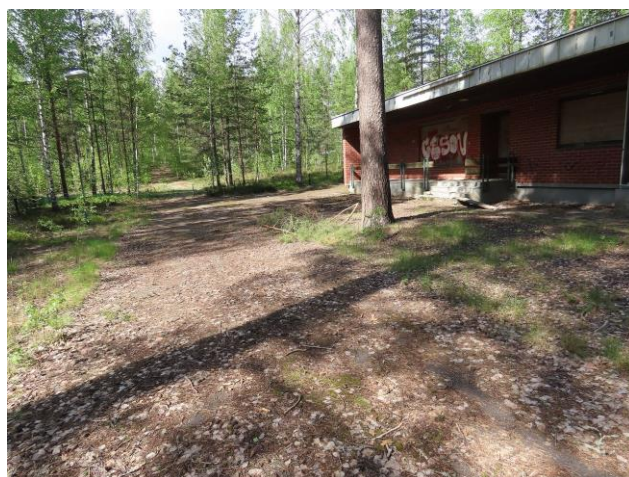
Kuva 26. Osa-alueen lounaisreuna pohjoiseen päin kuvattuna