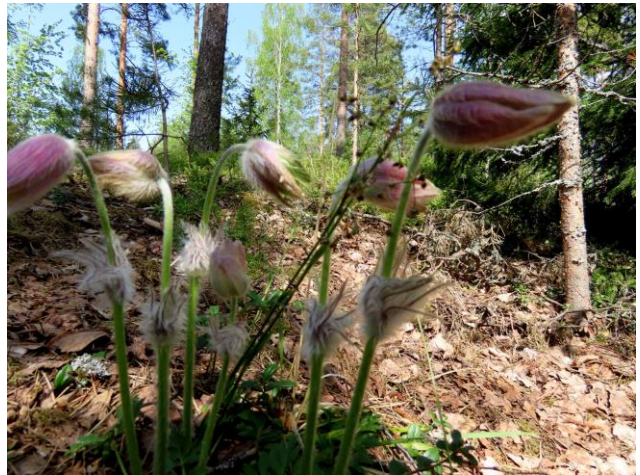
Kuva 24. Kangasvuokkokasvusto supan länsireunalla (LIITTEET Kartta 2.). Taustalla puutarhajatettä.

Alueen kasvilajisto todettiin tavanomaiseksi kangasmetsien lajistoksi. Osa-alueen suppakuopilla todettiin kulttuuribiotoopeille tyypillisiä lajeja sekä puutarhalajistoa, joka on tullut paikalle puutarhajätteen mukana. Pienemmän suppakuopan länsireunalla todettiin seitsemän kukkivaa kangasvuokkokasvustoa ja kolme kukatonta kasvustoa (Kuva 24. ja kansikuva.). Laji on uhanalainen (VU-laji) ja rauhoitettu (luonnonsuojeluasetus). Kasvi-inventoinnin yhteydessä seurattiin myös linnustoa. Lintulajisto todettiin tavanomaiseksi boreaalisten metisen lajistoksi (mm. peippo, punarinta ja mustarastas). Uhanalaisille lajeille (direktiivin IV(a) lajit) soveltuvia elinympäristöjä osa-alueella ei todettu.