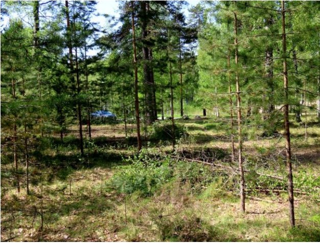
Kuva 1. Osa-alueen Huhmarkallion puoleinen nuori metsä kasvaa laajalti joutomaalla.