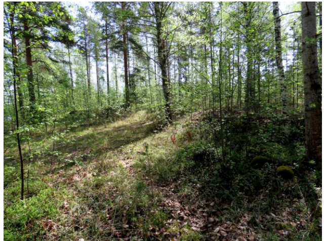
Kuva 4. Myös osa-alueen koillis- ja pohjoissivu ovat voimakkaasti muokattu ja kulttuurivaikuttaisia.

Suositus. Alueella ei todettu rauhoitettuja tai uhanalaisia kasvilajeja, uhanalaisia lintulajeja tai uhanalaisille lajeille (direktiivin IV(a) lajit) soveltuvia elinympäristöjä, jotka olisi erityisesti huomioitava maankäytön suunnittelussa. Alueella ei todettu kangasvuokkoa.