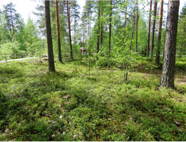
Kuva 21. Osa-alueen tasaista mäntykangasta (MT) eteläosasta koilliseen kuvattuna.