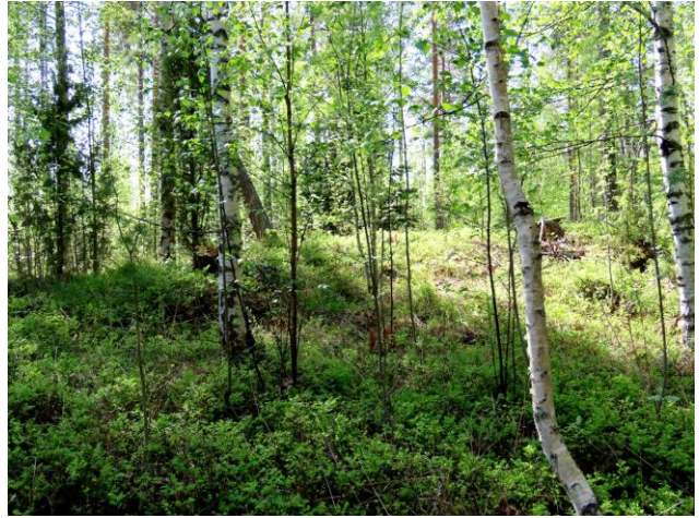
Kuva 2. Osa-alueen keskiosan on puustoltaan nuorta alkuperäisbiotooppia (MT).