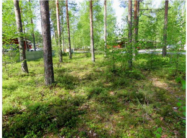
Kuva 6. Parrupolun puoleinen osa on jonkin verran kulunutta MT-kangasta.