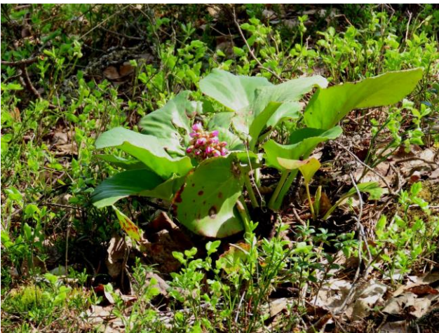
Kuva 13. Soikkovuorenkilpi ( Bergenia cordifolia ) on tullut puutarhajätteen mukana MT-kankaalle.