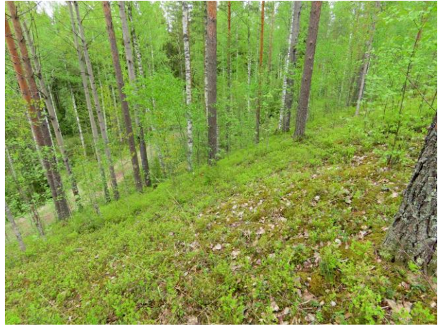
Kuva 18. Laajan supan koilliseen avautuvaa jyrkkää rinteä. Alla supan pohjalla kulkeva kuntopolku.