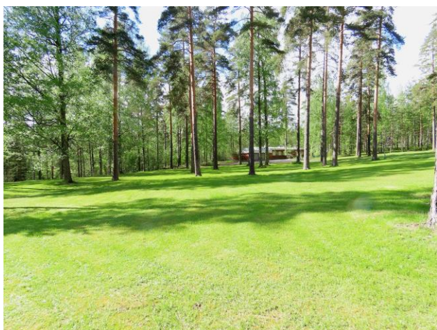
Kuva 25. Osa-alue kaakkoiskulmasta luoteeseen kuvattuna. Takana oikealla MT-kankaan saareke.

Suositus. Alueella ei todettu rauhoitettuja tai uhanalaisia kasvilajeja, uhanalaisia lintulajeja tai uhanalaisille lajeille (direktiivin IV(a) lajit) soveltuvia elinympäristöjä, jotka olisi erityisesti huomioitava maankäytön suunnittelussa.