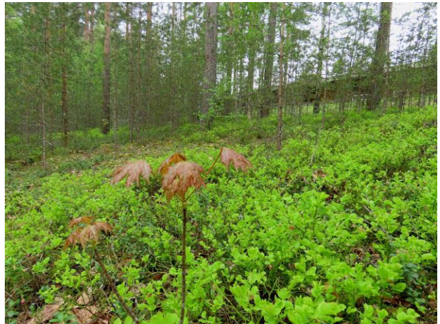
Kuva 30. Rivitalon ja kadun välistä mäntykangasta (MT). Etualalla vaahteraa. Kuvaussuunta länteen.