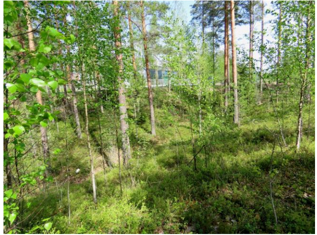
Kuva 22. Osa-alueen laajempi suppa. Taustalla Konstunkaaren lämpövoimala.