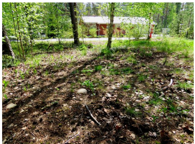
Kuva 10. Osa-alueen eteläosa on kulunutta MT/VT-kangasta, jossa todettiin kulttuuribiotoopin lajistoa.

Alueen kasvilajisto todettiin tavanomaiseksi tuoreen ja kuivan kangasmetsän lajistoksi. Osa-alueella todettiin jonkin verran myös kulttuuribiotoopeille tyypillisiä lajeja. Kasvi-inventoinnin yhteydessä seurattiin myös linnustoa. Niukka lintulajisto todettiin tavanomaiseksi boreaalisten metsien lajistoksi. Uhanalaisille lajeille (direktiivin IV(a) lajit) soveltuvia elinympäristöjä osa-alueella ei todettu.