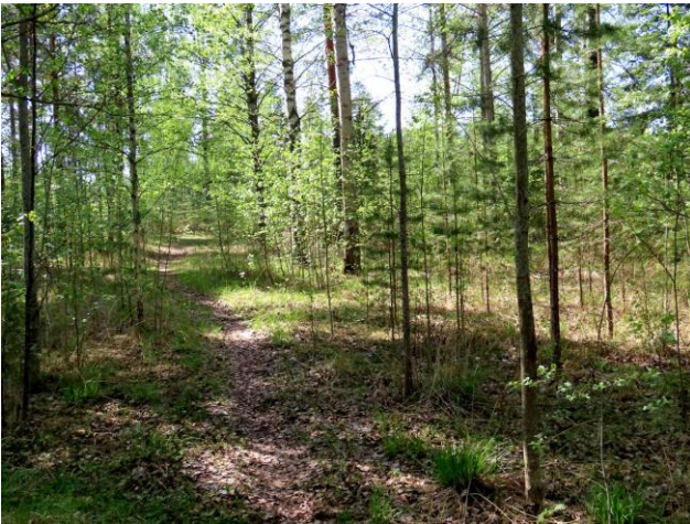
Kuva 3. Osa-alueen läpi kulkee useita polkuja mm. Konstunkaareltä uimarannalle.