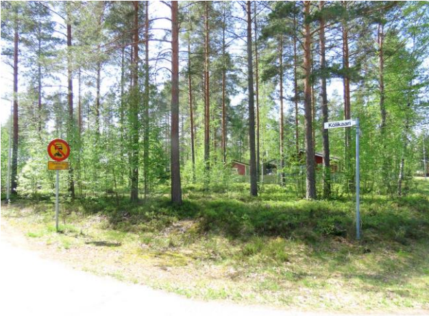
Kuva 5. Kölikaaren läntinen osa-alue on tuoretta kangasmetsää (MT). Kuva Parrupolun risteyksestä.