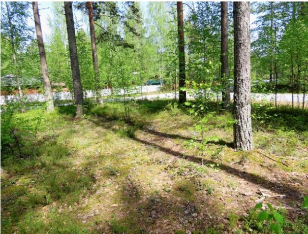
Kuva 7. Kölikaaren osa-alueen eteläosa on selvästi kulunutta MT-kangasta. Taustalla Parrupolun risteys