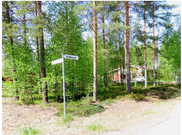
Kuva 8. Kölikaaren eteläosan osa-alue Lotjapolun puolelta kuvattuna. MT-kangasta, osin VT-kangasta.