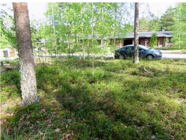
Kuva 9. Osa-alueen pohjoiskulma on kulunutta MT-kangasta. Kuvaussuunta Kölikaarelle päin.