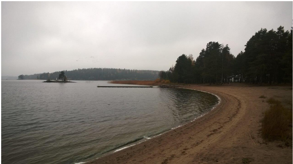
Muuttolinnut Konstunhiekan yllä lokakuussa 2018