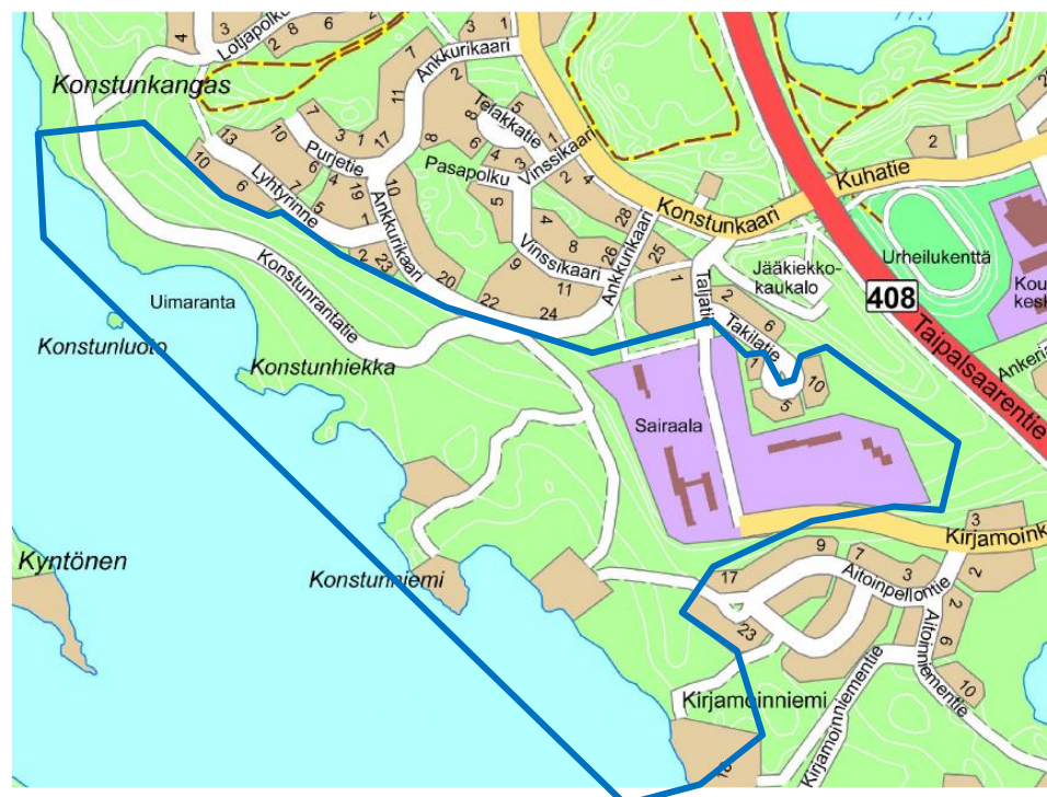
Suunnittelualueen paikallinen sijainti likimäärin sinisellä