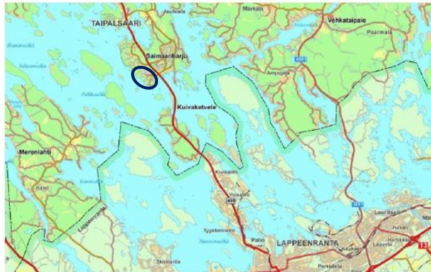
Suunnittelualueen likimääräinen seudullinen sijainti sinisellä

Asemakaavan muutoskohde sijaitsee Taipalsaaren kunnassa Konstunkankaan lounaisella ranta-alueella (Konstunhiekkä, Konstunniemi) sekä entisellä sairaala-alueella (nyk. Taipolis). Alueen tiloja pääasiassa ovat kookkaat kunnan omistamat tilat 831-409-1-116 Konstunkangas, 1-994 Konstunpuisto ja 1-253 Sairaalaharju. Kunta on käynyt neuvotteluja yksityisten maanomistajien kanssa pienempien tilojen 1-130, 2-7 ja 2-17 mukaan ottamisesta. Tarkoituksenmukaisen kokonaisuuden aikaansaamiseksi kyseiset tilat ovat mukana hankkeessa. Kunta on laatinut kaavoitus sopimukset tilojen omistajien kanssa.