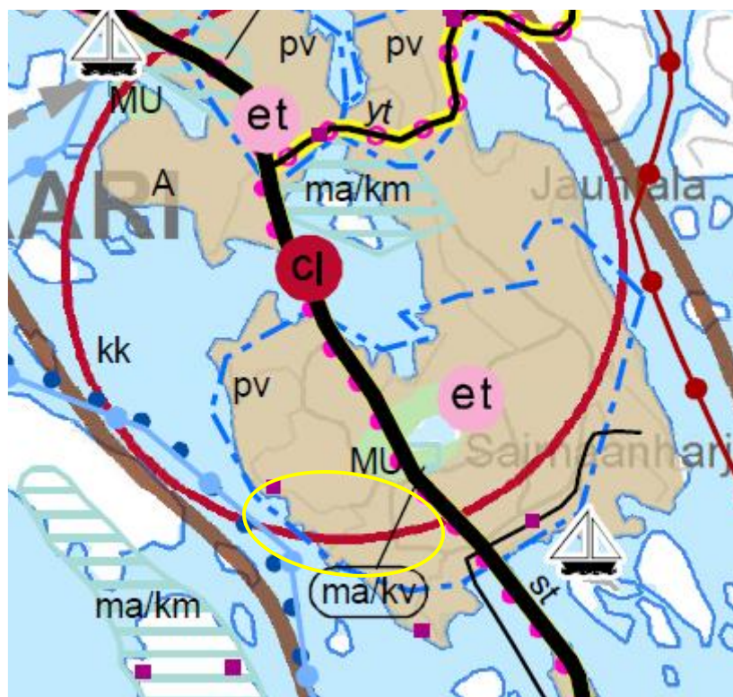
Ote vahvistetusta maakuntakaavasta (yhdistelmä), suunnittelualue likimäärin osoitettu keltaisella

Etelä-Karjalan maakuntavaltuusto hyväksyi Etelä-Karjalan 1. vaihemaakuntakaavan 24.2.2014. Vaihekaava kattaa koko maakunnan ja teemana on kaupallisten palveluiden, elinkeinoelämän ja liikenteen kehittämismahdollisuudet. Se korvasi 21.12.2011 vahvistetun Etelä-Karjalan maakuntakaavan vaihekaavan aluevarausten osalta.