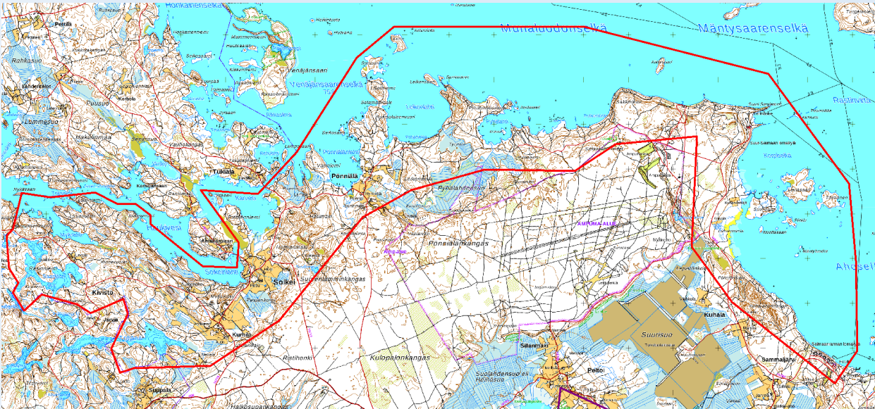
Solkein – Pönniälän alueen rantayleiskaavan alustava rajaus