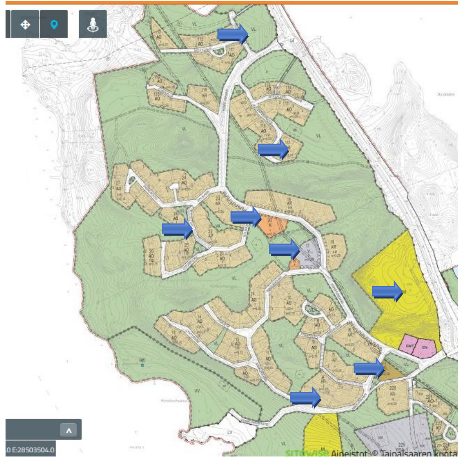
Suunnittelualueen likimääräiset sijainnit

Suunnittelualueet ovat osin rakentamatonta, pääosin mäntyvaltaista metsää. Kortteliin neljä on rakennettu uudehkoja omakotitaloja ja rivitaloja. Korttelissa 117 toiselle tonteista on rakennettu uusi omakotitalo.